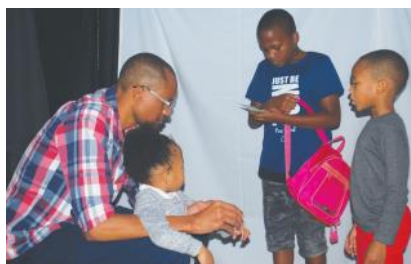
’n Pa en sy drie kinders bid by die leë graf

Die Via Dolorosa is ook ’n evangelisasiegeleentheid en vir sommiges het dit geestelike vernuwings gebring. Ds Liebenberg vertel van die ommaswaai in die lewe van ’n man uit Malawi wat by stasie 5 by ’n kruis voor die uitdaging van vergifnis gestaan het. Reisigers is genooi om die naam van iemand neer te skryf wat hulle wil vergewe en dié naam met ’n spyker teen ’n kruis vas te slaan. Hy kon dit eers nie doen nie en het toe sy gesin gaan haal om die Lydensweg vir ’n tweede keer te onderneem. Hier, voor die kruis het hulle die man wat ’n familielid vermoor het, onvoorwaardelik vergewe.